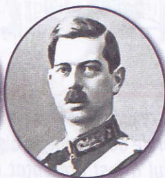
Carol al II-lea